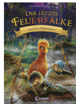
Der letzte Feuerfalke und das Silbermoor (Band 8)