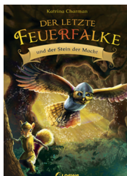
Der letzte Feuerfalke und der Stein der Macht (Band 1)