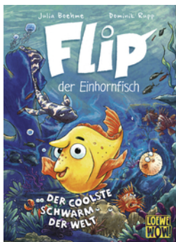
Flip, der Einhornfisch (Band 1) - Der coolste Schwarm der Welt