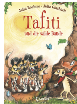
Tafiti und die wilde Bande (Band 20)