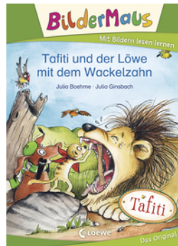
Bildermaus - Tafiti und der Löwe mit dem Wackelzahn