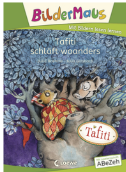
Bildermaus - Tafiti schläft woanders