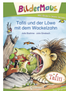
BilderMaus - Tafiti und der Löwe mit dem Wackelzahn