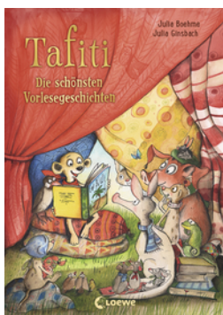
Tafiti - Die schönsten Vorlesegeschichten