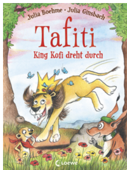
Tafiti - King Kofi dreht durch (Band 21)