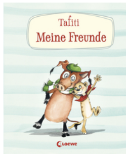
Tafiti - Meine Freunde