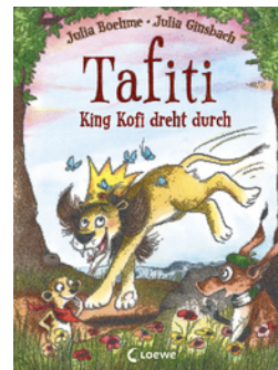
Tafiti - King Kofi dreht durch (Band 21)