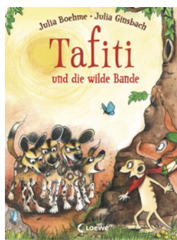
Tafiti und die wilde Bande (Band 20)