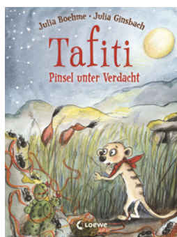
Tafiti (Band 22) - Pinsel unter Verdacht