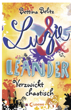
Luzie & Leander - Verzwickt chaotisch