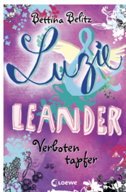
Luzie & Leander - Verboten tapfer