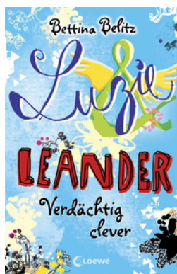
Luzie & Leander - Verdächtig clever