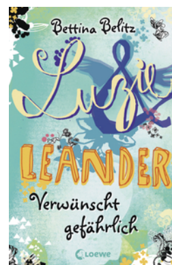
Luzie & Leander - Verwünscht gefährlich