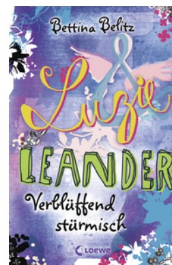
Luzie & Leander - Verblüffend stürmisch