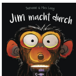
Jim macht durch