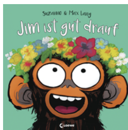
Jim ist gut drauf