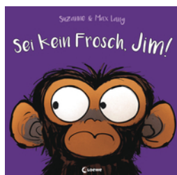
Sei kein Frosch, Jim!