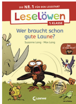
Leselöwen 1. Klasse - Jim ist mies drauf - Wer braucht schon gute Laune?