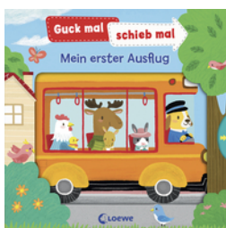
Guck mal, schieb mal! - Mein erster Ausflug