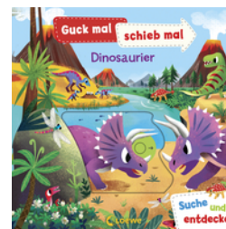
Guck mal, schieb mal! Suche und entdecke - Dinosaurier