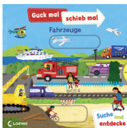
Guck mal, schieb mal! Suche und entdecke - Fahrzeuge