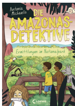
Die Amazonas-Detektive (Band 4) - Ermittlungen im Nationalpark