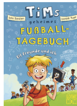
Tims geheimes Fußball- Tagebuch (Band 1) - Elf Freunde und ich!