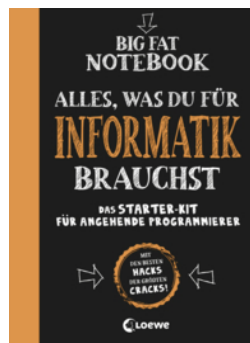
Big Fat Notebook - Alles, was du für Informatik brauchst - Das Starterkit für angehende Programmierer