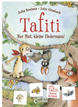
Tafiti - Nur Mut, kleine Fledermaus!