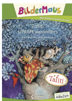
Bildermaus - Tafiti schläft woanders