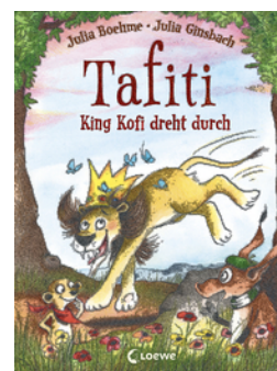
Tafiti - King Kofi dreht durch (Band 21)