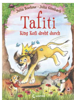
Tafiti - King Kofi dreht durch (Band 21)