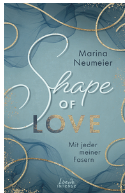
Shape of Love - Mit jeder meiner Fasern (Love-Trilogie, Band 1)