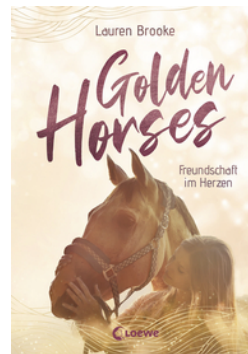
Golden Horses (Band 3) - Freundschaft im Herzen