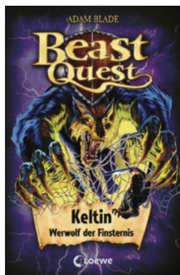
Beast Quest (Band 68) - Keltin, Werwolf der Finsternis