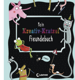
Mein Kreativ-Kratzel Freundebuch