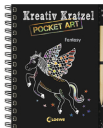
Kreativ-Kratzel Pocket Art: Fantasy