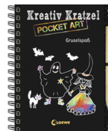
Kreativ-Kratzel Pocket Art: Gruselspaß