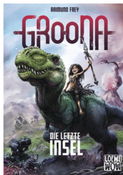
Groona - Die letzte Insel