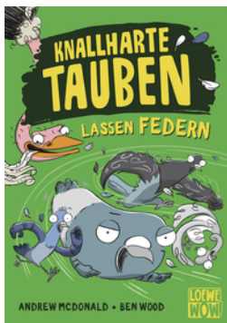
Knallharte Tauben lassen Federn (Band 2)