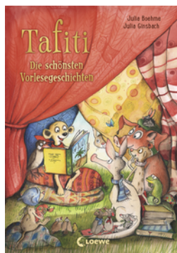
Tafiti - Die schönsten Vorlesegeschichten