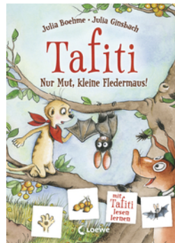
Tafiti - Nur Mut, kleine Fledermaus!