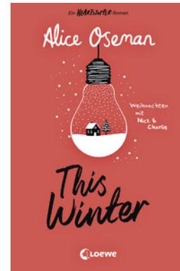
This Winter (deutsche Ausgabe)