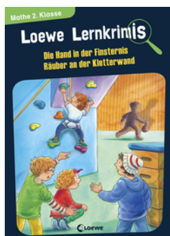
Loewe Lernkrimis - Die Hand in der Finsternis / Räuber an der Kletterwand