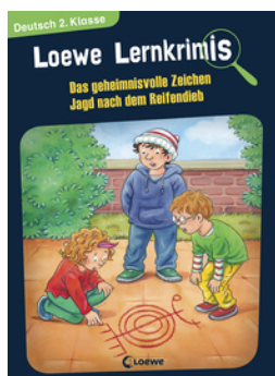
Loewe Lernkrimis - Das geheimnisvolle Zeichen / Jagd nach dem Reifendieb