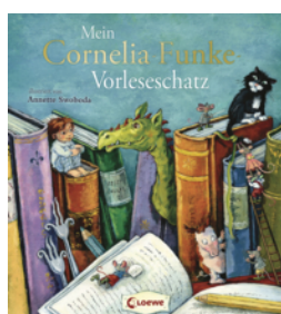
Mein Cornelia-Funke- Vorleseschatz