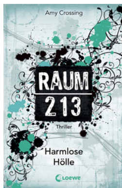
Raum 213 (Band 1) – Harmlose Hölle