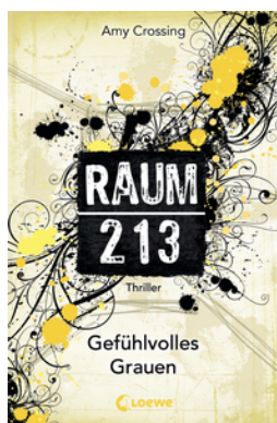
Raum 213 (Band 3) – Gefühlvolles Grauen