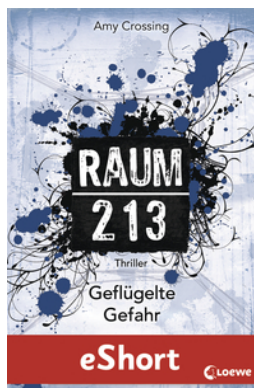
Raum 213 – Geflügelte Gefahr