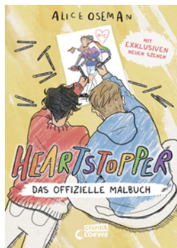
Heartstopper - Das offizielle Malbuch