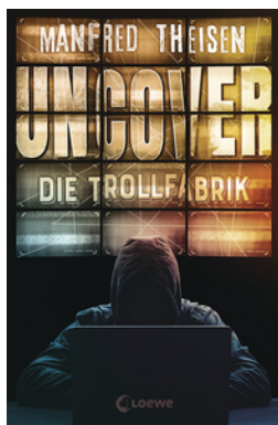
Uncover - Die Trollfabrik