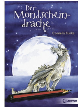
Der Mondschein- drache

... und 37 weitere Titel des Autors vorhanden.