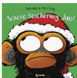
Schöne Bescherung, Jim!