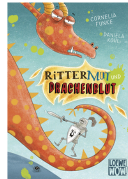
Rittermut und Drachenblut