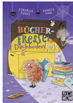
Bücherfresser und Dachbodenspuk