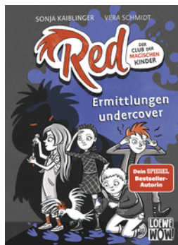
Red - Der Club der magischen Kinder (Band 2) - Ermittlungen undercover