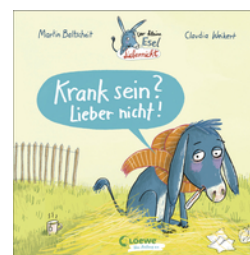
Der kleine Esel Lieber nicht - Krank sein? Lieber nicht!