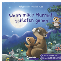
Wenn müde Murrel schlafen gehen