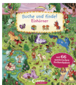
Suche und finde! Einhörner