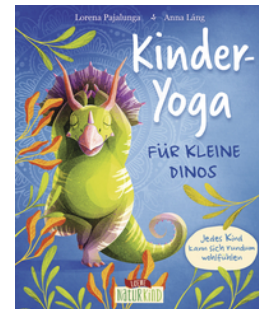
Kinder-Yoga für kleine Dinos