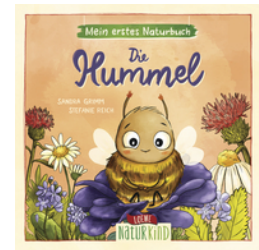
Mein erstes Naturbuch - Die Hummel