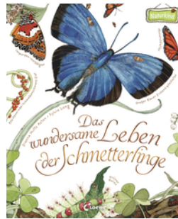
Das wundersame Leben der Schmetterlinge