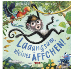
Laaangsam, kleines Äffchen!