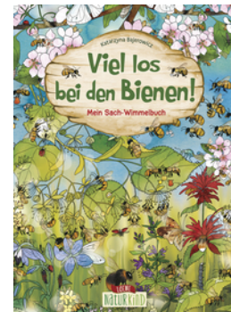
Viel los bei den Bienen!