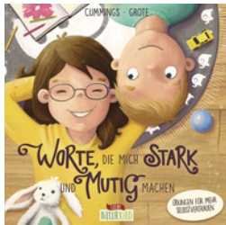
Worte, die mich stark und mutig machen