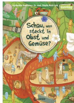
Schau, was steckt in Obst und Gemüse?