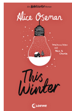
This Winter (deutsche Ausgabe)