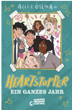
Heartstopper - Ein ganzes Jahr (Yearbook)