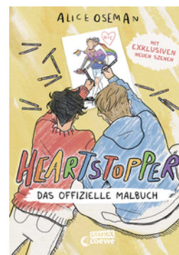
Heartstopper - Das offizielle Malbuch