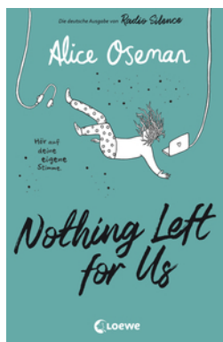
Nothing Left for Us (deutsche Ausgabe von Radio Silence)