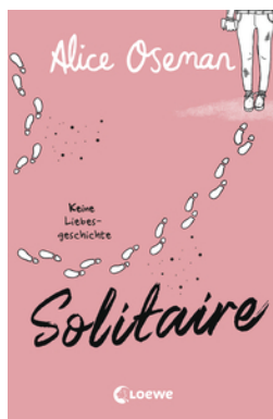
Solitaire (deutsche Ausgabe)