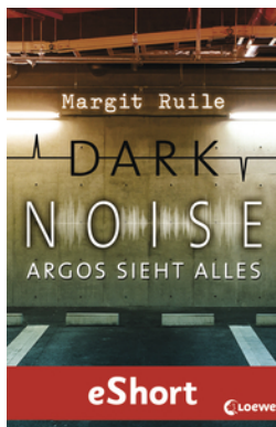
Dark Noise - Argos sieht alles