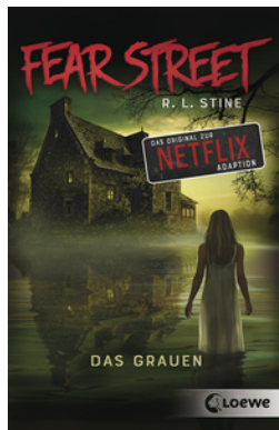
Fear Street - Das Grauen