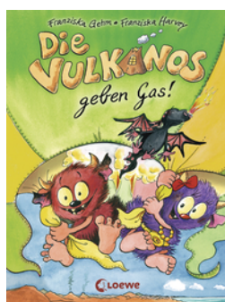
Die Vulkanos geben Gas! (Band 5)