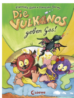
Die Vulkanos geben Gas! (Band 5)