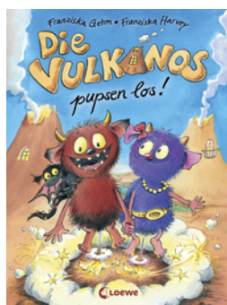
Die Vulkanos pupsen los! (Band 1)