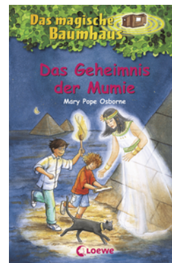
Das magische Baumhaus (Band 3) - Das Geheimnis der Mumie