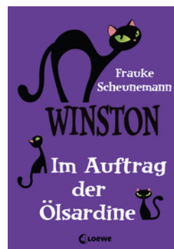
Winston – Im Auftrag der Ölsardine