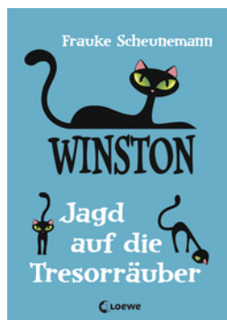
Winston – Jagd auf die Tresorräuber