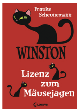
Winston - Lizenz zum Mäusejagen