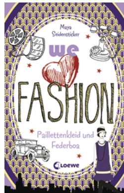
we love fashion (Band 3) – Paillettenkleid und Federboa