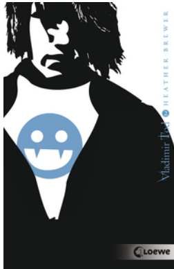
Vladimir Tod beisst sich durch