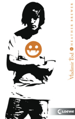
Vladimir Tod kämpft verbissen