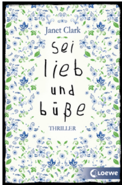
Sei lieb und büße