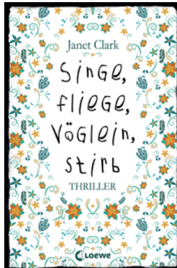
Singe, fliege, Vöglein, stirb