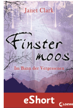
Finstermoos – Im Bann der Vergessenen