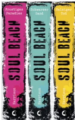
Soul Beach - Die komplette Trilogie