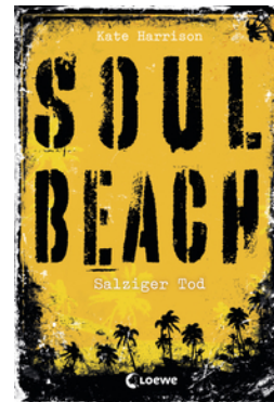
Soul Beach – Salziger Tod