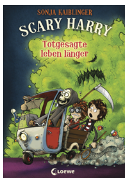
Scary Harry 2 - Totgesagte leben länger