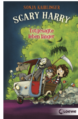
Scary Harry (Band 2) - Totgesagte leben länger