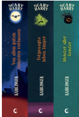
Scary Harry (Band 1-3)