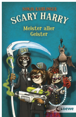
Scary Harry (Band 3) - Meister aller Geister