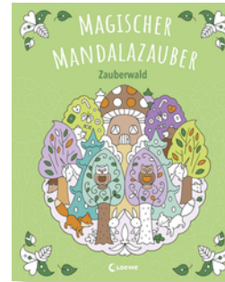
Magischer Mandalazauber - Zauberwald