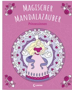
Magischer Mandalazauber - Prinzessinnen