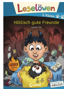
Leselöwen 2. Klasse - Höllisch gute Freunde