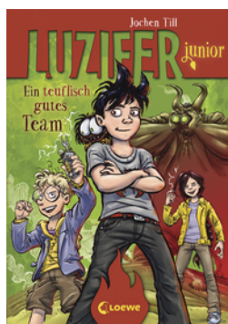
Luzifer junior (Band 2) - Ein teuflisch gutes Team