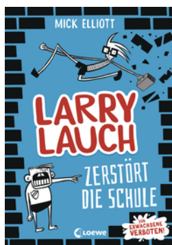
Larry Lauch zerstört die Schule (Band 1)