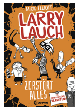
Larry Lauch zerstört alles (Band 3)