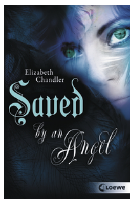
Kissed by an Angel (Band 3) – Saved by an Angel