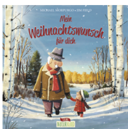
Mein Weihnachtswunsch für dich