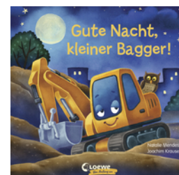
Gute Nacht, kleiner Bagger!