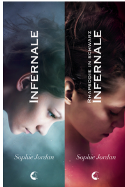
Infernale - Doppelbundle