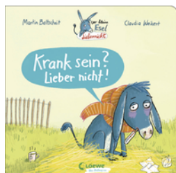
Der kleine Esel Liebernicht - Krank sein? Lieber nicht!