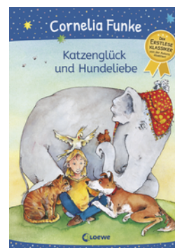
Katzenglück und Hundeliebe