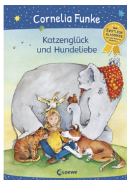
Katzenglück und Hundeliebe