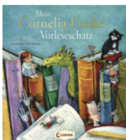
Mein Cornelia-Funke- Vorleseschatz